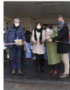
A sinistra la consegna delle medaglie d'onore nella sede della Provincia. A destra il taglio del nastro alle scuole Frank

IL MALE DA DEBELLARE Anpi e studenti hanno presentato ricerche e analisi sull'antisemitismo